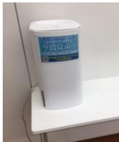
空気清浄化加湿器 次亜塩素酸水を噴霧し空間の除菌、 消臭を行っています。【8台保有】