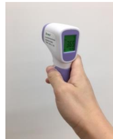
非接触型体温計 数に限りが御座いますので ご利用の際はお早めにお申し 付け下さい。【在庫2台】