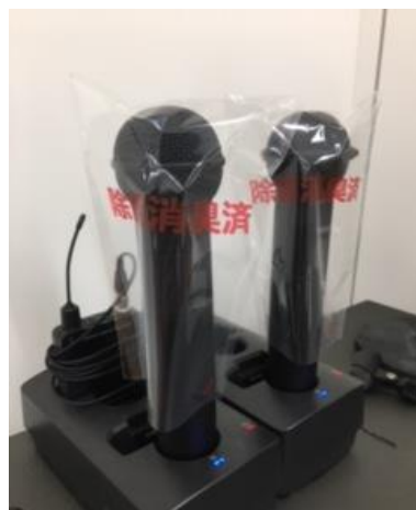
除菌済みマイク(有料) 各部屋ご利用毎に殺菌消毒を行い 消毒済みカバーを付けております。