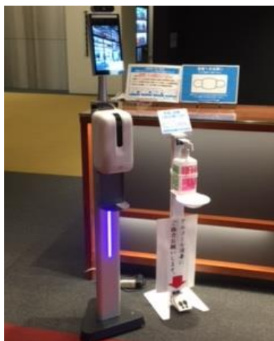
サーマルカメラ(自動体温測定) 来場者様の体温感知とマスク着用の 有無を確認しております。 【3階フロント前に設置】