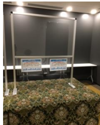
受付用アクリルパネル 飛沫感染防止用にアクリルパネルを ご用意しております。【在庫4台】