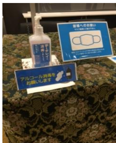
手指消毒スプレー 当ビル入口・3F、4F受付に 手指消毒液を設置しております。

◆ 皆様に安心してご利用頂ける様、当ビルのホール・会議室では以下の備品をご準備しております。